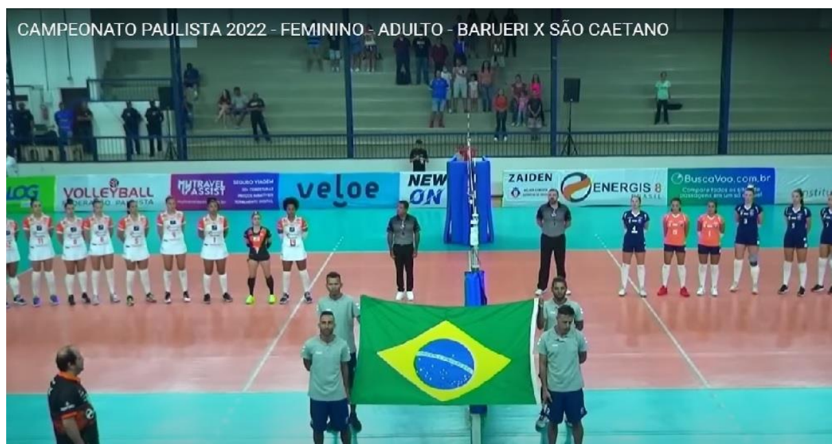
Partida entre a equipe Barueri e São Caetano pelo Campeonato Paulista.

Foram analisadas as possibilidades e o conhecimento técnico-tática das jogadoras, seus fundamentos e foi feito o aprimoramento da fundamentação geral.