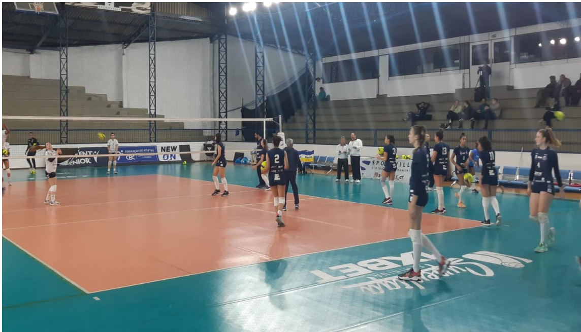
Jogo entre Barueri e São Carlos