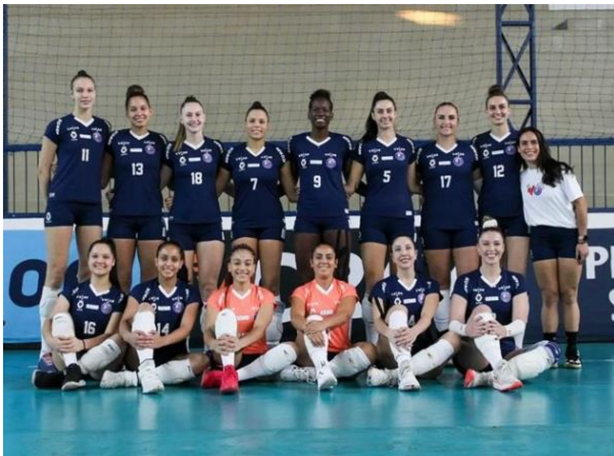
Equipe de Vôlei Barueri 2022.