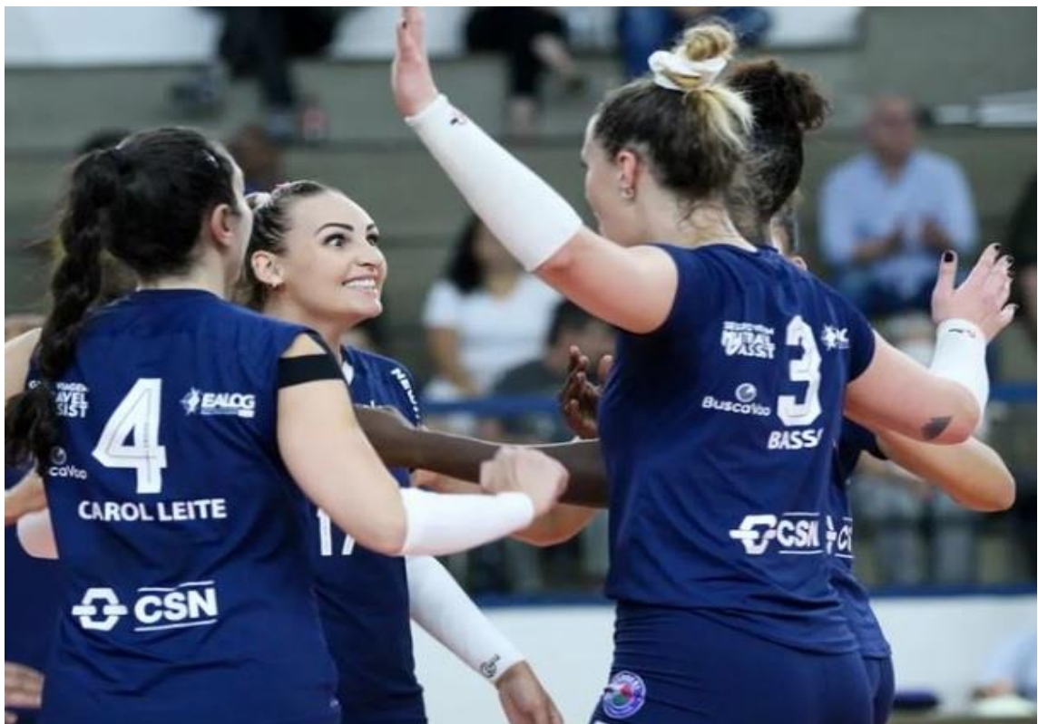
Atletas do Barueri comemorando a vitória expressiva na partida contra a equipe São Carlos por 3x0 fora de casa.