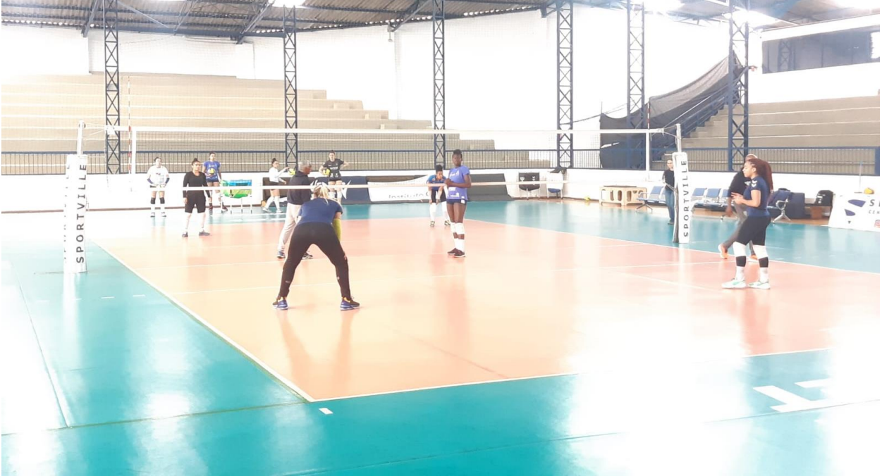
Atletas durante os treinamentos